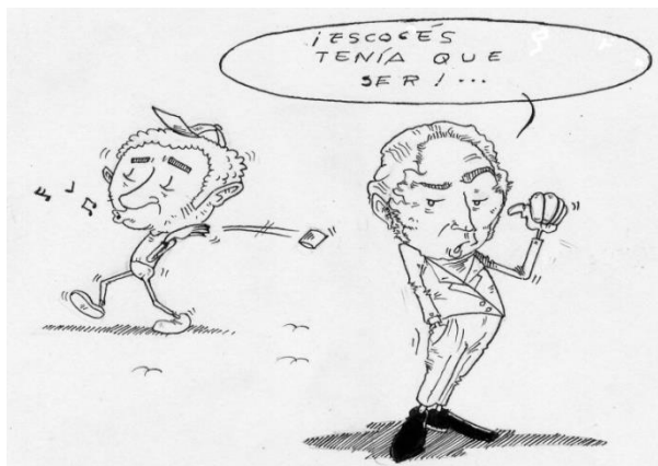
Viñeta de Quetelet 16

Entre otras facetas científicas y artísticas de este personaje, cabe destacar que fue pintor, y compuso una ópera.