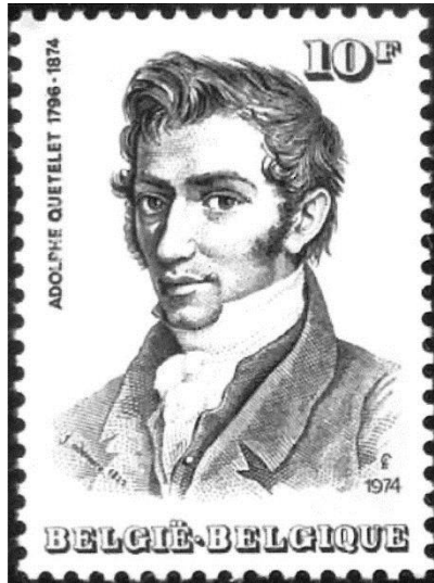
Este sello conmemorativo de diez francos belgas se realizó en el centenario de su muerte.

Cuando viajó a Inglaterra creó, la Sección de Estadística de la Asociación para el desarrollo de la Ciencia en Cambridge en 1833. Al año siguiente, se crea la Sociedad Estadística de Londres, y Quetelet fue nombrado miembro de ella. Esta sociedad en 1887 pasará a denominarse Royal Statistical Society.